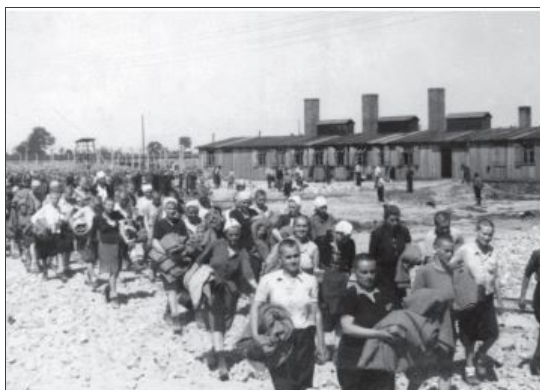
Foto 23 - Maggio 1944, Birkenau. Prigionieri avviate ai loro blocchi all'interno del campo.